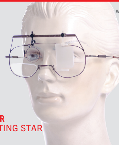
WINNER SHOOTING STAR I

Mit verstellbaren Bügeln – die Winner Tradition Vario ist die verstellbare Version der klassischen Tradition und in zwei Größen erhältlich: „small“ – für schmale Köpfe, und „large“ als Normalgröße