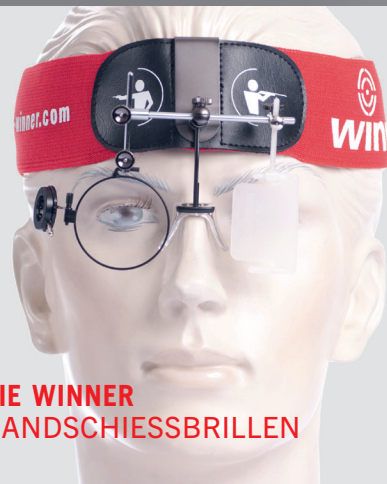
WINNER BANDSCHIESSBRILLE Ø42 MM MIT AUSGEKLAPPTER SCHWENKIRISBLLENDE